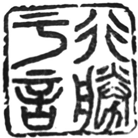
▲篆刻·行胜于言 湖南汨罗 任行宽 70岁