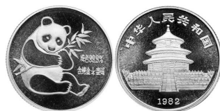
82版的1/4盎司熊猫金币

琳提醒,第一,关注黄金价格;第二,关注发行总量;第三,关注长短线投资的关系。通常情况下,发行年份越早的熊猫金币价格越高。