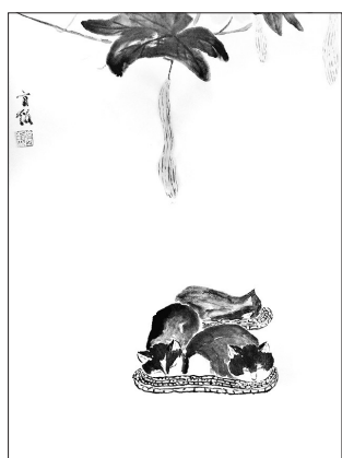
▲ 国画·酣梦 江苏连云港 徐宜超 56岁