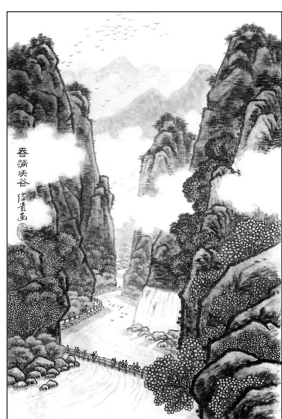
▲ 国画·春满峡谷 陕西石泉 吴俭贵 83岁