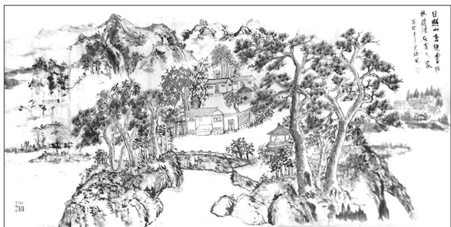
▲ 国画·日照山峦 山东滨州 王忠瑞 77岁