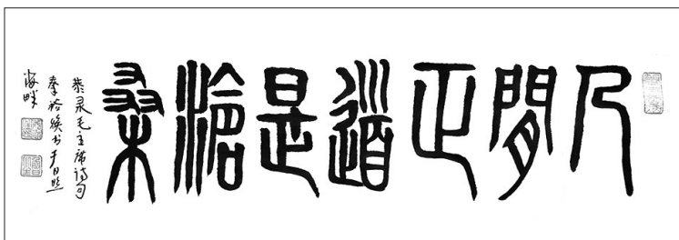
▲书法·人间正道是沧桑 山东日照 秦裕煥 82岁