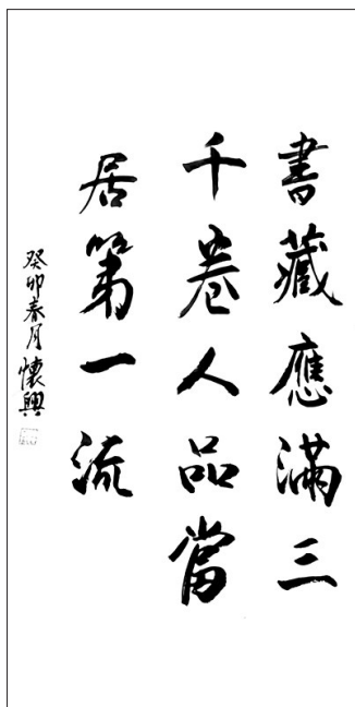
▲书法·书藏应满三千卷 人品当居第一流 山东滨州 鹿怀兴 74岁