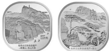
峨眉山-乐山大佛币和黄山币背面

22时至4月2日24时，兑换期为4月7日至4月13日。公众可通过承办银行官方网站、手机银行及微信公众号等渠道进行预约。