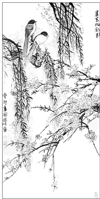
▲ 国画·春天的欢歌 山东济南 刘保顺 67岁