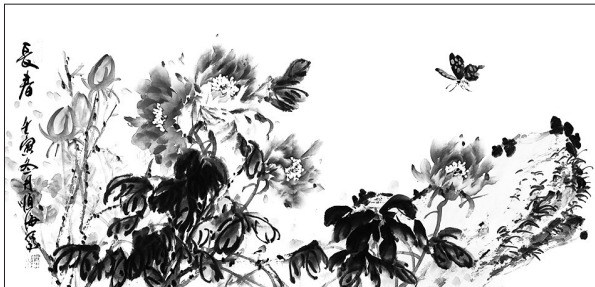
▲ 国画·长春 浙江金华 洪顺海 83岁