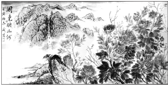
▲ 国画·国色映山河 上海 何盛芝 80岁