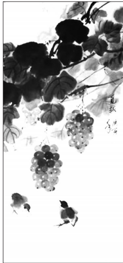
▲ 国画·觅趣 辽宁沈阳 郭宁 68岁