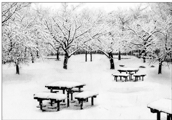
▲ 水彩画·冬的洁净 辽宁抚顺 徐成文 65岁