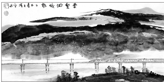
▲ 国画·云壑游蛟龙 湖北武汉 夏清平 69岁