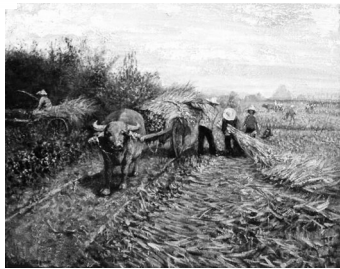
▲ 油画·农家地里忙 辽宁抚顺 徐淑荣 65岁