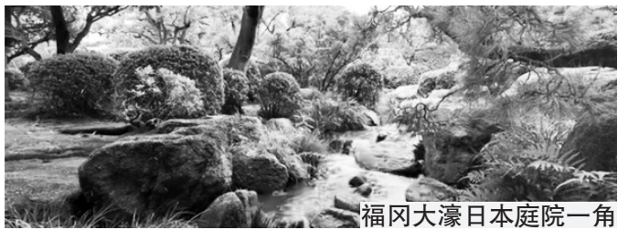
福冈大濠日本庭院一角

秋季的济州不仅有美景,更有甜蜜的馈赠。当地的橘子在11月迎来丰收,你或许会偶遇提着竹篮采摘橘子的当地老人,不妨上前讨教一二,亲手摘下一颗品尝,感受这份来自大自然的甘甜。此外,秋季的济州还保留着古耽罗王国特别