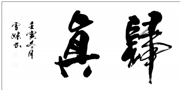
▲ 书法·归真 安徽宿州 赵雪妹 53岁