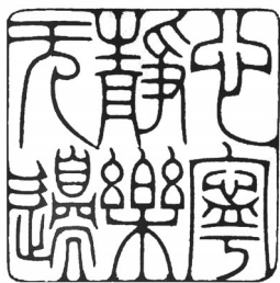
▲ 篆刻·心宁静 乐无边 山东临沂 王平 63岁