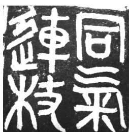
▲ 篆刻·同气连枝 山东滨州 鹿怀兴 77岁