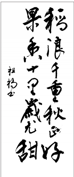
书法·稻浪千重秋正好 果香十里岁尤甜 福建泰宁 陈祖福 81岁