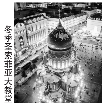
冬季圣索菲亚大教堂