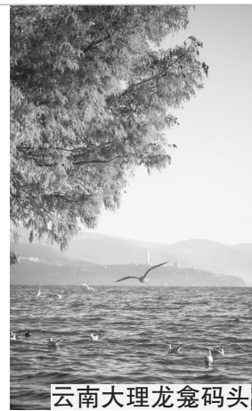
云南大理龙龕码头