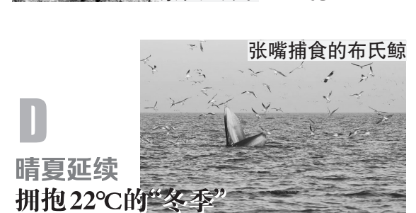
张嘴捕食的布氏鲸