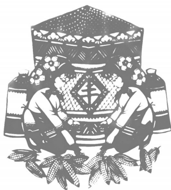
▲ 剪纸·仓满粮足 辽宁抚顺 徐成文 68岁

专栏主理人 苗云泽(从事诗联创作近40年,作品散见于《对联》《中国楹联报》等报刊书籍)