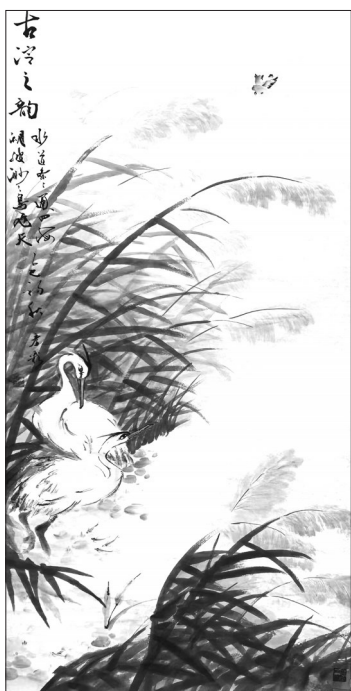
▲ 国画·古淀之初 河北博野 李彦彩 65岁