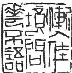
▲ 篆刻·渐入佳境问花不语 湖北武汉 夏清平 69岁