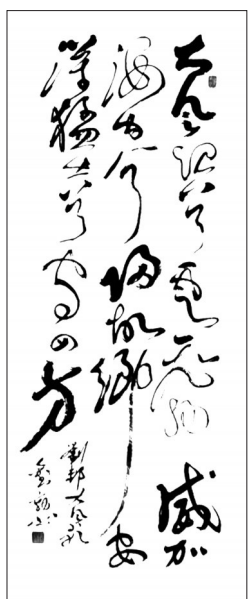
▲ 书法·汉代刘邦《大风歌》 内蒙古 刘才 67岁