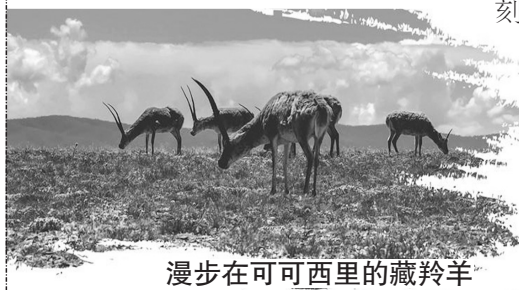
漫步在可可西里的藏羚羊

另有几处鲜为人知的秘境时刻:沱沱河日出,列车在清晨经过长江源区,晨雾中的沱沱河如银色丝带蜿蜒;唐古拉山口,深夜经过海拔5072米的世界铁路最高点,星空仿佛触手可及;那曲草原,夏季车窗外的羌塘草原开满那锦梅朵,牧民的黑色帐篷升起袅袅炊烟。