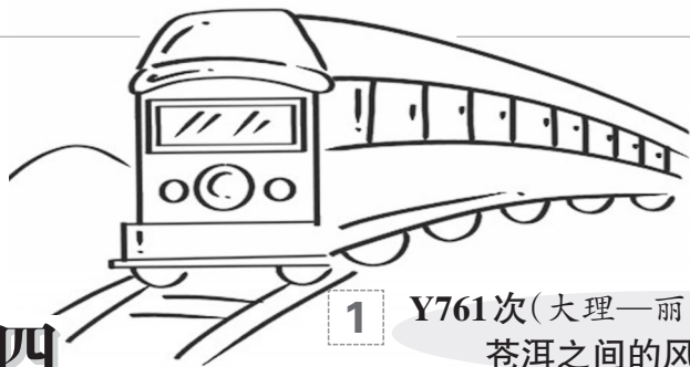
1 Y761次(大理—丽江,13:35—18:04) 苍洱之间的风花雪月专列

阖家出国过年,怎样最有年味儿?从目前的搜索和预订量来看,新西兰皇后镇TSS厄恩斯劳号蒸汽船成为春节最火热的国外景区之一。2月底,国内正值寒冬,新西兰却暖意融融,登上这艘与泰坦尼克号“同龄”的百年蒸汽船,游客可以在挂满新春装饰的牧场庄园里吃一顿团圆饭,还能体验新西兰本土特色活动,观看牧羊犬赶羊、剪羊毛表演,过一个兼具仪式感和新鲜感的新年。(文/杨金祝 罗田怡 龚善美)