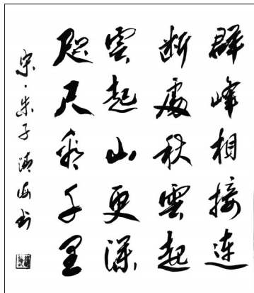
▲ 书法·宋代朱熹《题可老所藏徐明叔画卷二首·其一》 福建三明 谢清海 90岁