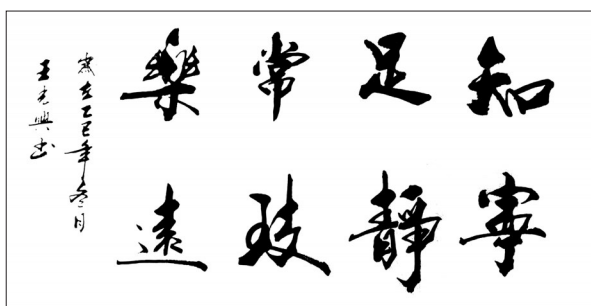
▲ 书法·知足常乐 宁静致远 广东中山 王光兴 63岁