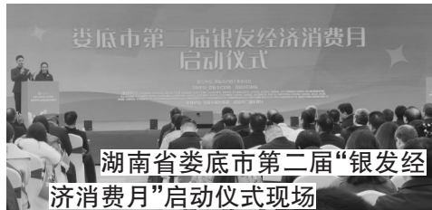
湖南省娄底市第二届“银发经济消费月”启动仪式现场

冬日的孙水公园广场,寒意被火热的人气驱散。一款能语音播报的互联网智能药盒吸引了众多银发族的目光。70岁的刘先生听着清晰的服药提醒,频频点头:“孩子在外地工作,总怕我忘了吃药。有了这个,他们放心,我也省心。”他的笑容,成为了湖南省娄底市第二届“银发经济消费月”最生动的注脚。(本报记者武维利)