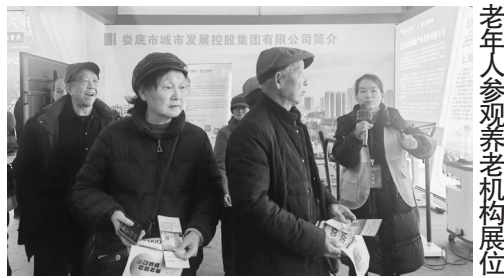
老年人参观养老机构展位

老年友好城市不是口号,它由无数嵌入日常生活的温暖细节编织而成。在娄底,这张网的经纬线是“家门口”的精准服务。