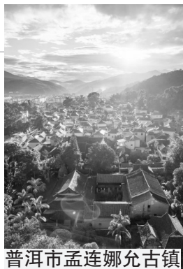
普洱市孟连娜允古镇

作为西昌的母亲湖,邛海历来有“川南胜境”之称。这个由地层断裂形成的天然湖泊,每到秋末冬初,天鹅、鹭鸶、沙鸭等候鸟就会成群结队飞来避寒。冬季里,四川不少地方阴冷潮湿,这里却和风习习,在湖上泛舟,真有仲春江南之感。