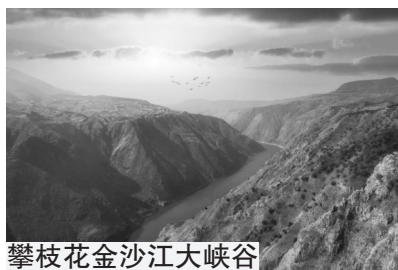
陵水清水湾自由灯塔

这里有“会唱歌的沙滩”清水湾,海水澄澈,沙质细腻;有国内顶尖的潜水胜地分界洲岛,是海南最适宜潜水、探索海底世界的地方之一。此外,你还能探访古老的“海上浮城”疍家渔排,体验独特的水上人家生活。