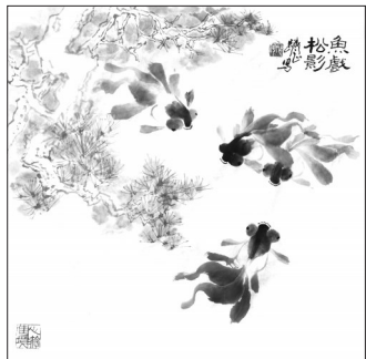
▲ 水墨·鱼戏松影 江苏海安 仲跻止 74岁