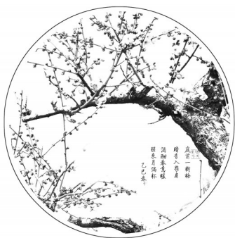
▲ 国画·红梅闹春 安徽合肥 周先中 83岁