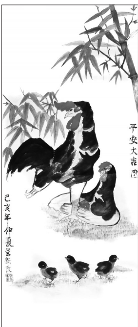
▲ 国画·平安大吉 河北石家庄 吴新政 77岁